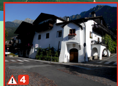
Töller: Achtung unübersichtliche Kreuzung. Eingang zum Dorfzentrum. Zebrastrifen benutzen.