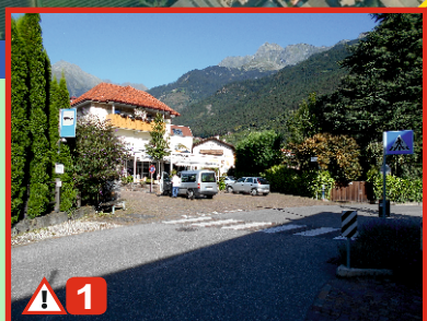
Café Steinach: Achtung vor dem Verkehr. Vorsicht bei parkenden Autos und der Bushaltestelle.