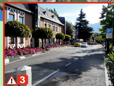
Gemeinde: Achtung Verkehrsknotenpunkt. Viel Verkehr durch Bushaltestellen in beide Richtungen, Ein- und Ausfahrt, Parkplatz und Tiefgarage.