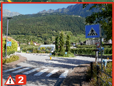
Bachguter Kreisverkehr: Achtung vor dem Autoverkehr. Erhöhte Geschwindigkeit da Ende der Landesstraße und Beginn der Zone 40.